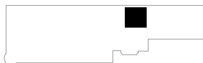
lokalizacja apartamentu na kondygnacji: