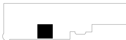
lokalizacja apartamentu na kondygnacji: